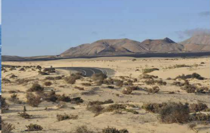
DUNAS DE CORRALEJO