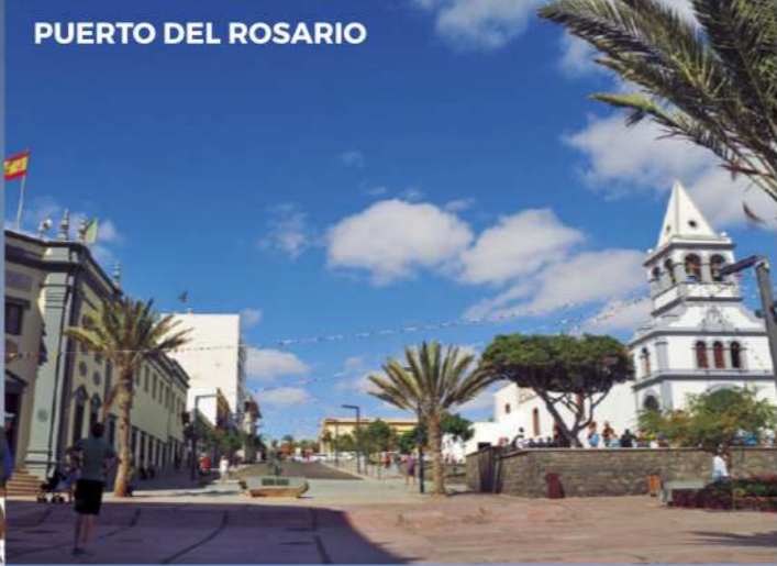
PUERTO DEL ROSARIO