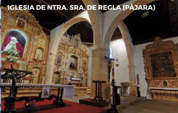
IGLESIA DE NTRA. SRA. DE REGLA (PÁJARA)