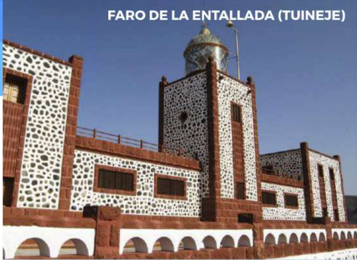
FARO DE LA ENTALLADA (TUINEJE)