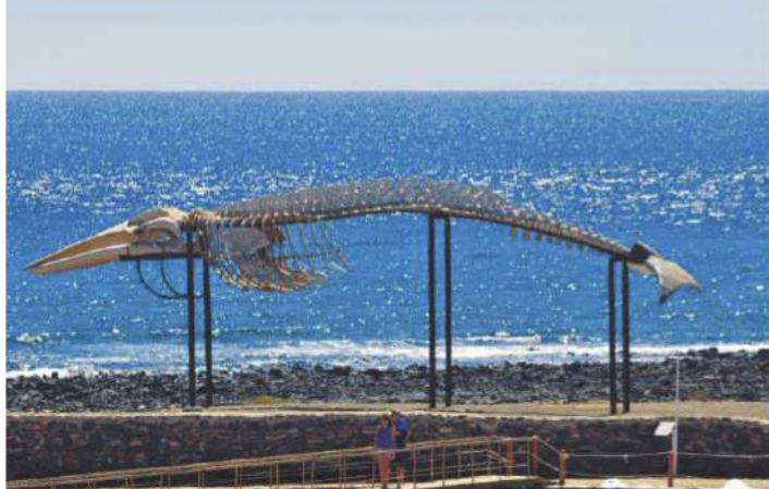
SALINAS DEL CARMEN